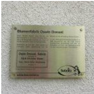
Blumenfabrik Oswin Dressel Weberstraße 20