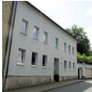
Blumenfabrik Gustav Döring Weberstraße 8